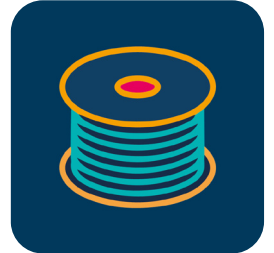
SCHÉMA DE PRINCIPE DE LA TECHNOLOGIE

L'offre de collecte est portée par une porte de collecte CAP V2 mutualisée, qui permet de collecter l'ensemble des offres Pro du catalogue (Connect, Access, Premium). La porte de collecte peut être souscrite en local ou en national et existe en version 1G ou 10G. Cette porte fait uniquement l'objet de FAS et n'engendre aucune facturation récurrente. Elle peut être sécurisée en actif/passif : porte nationale sécurisée en national et porte locale sécurisée en local.